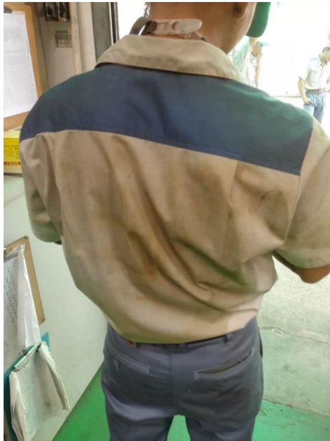
汗と鉄粉の混ざったシミの痕がとれない作業着