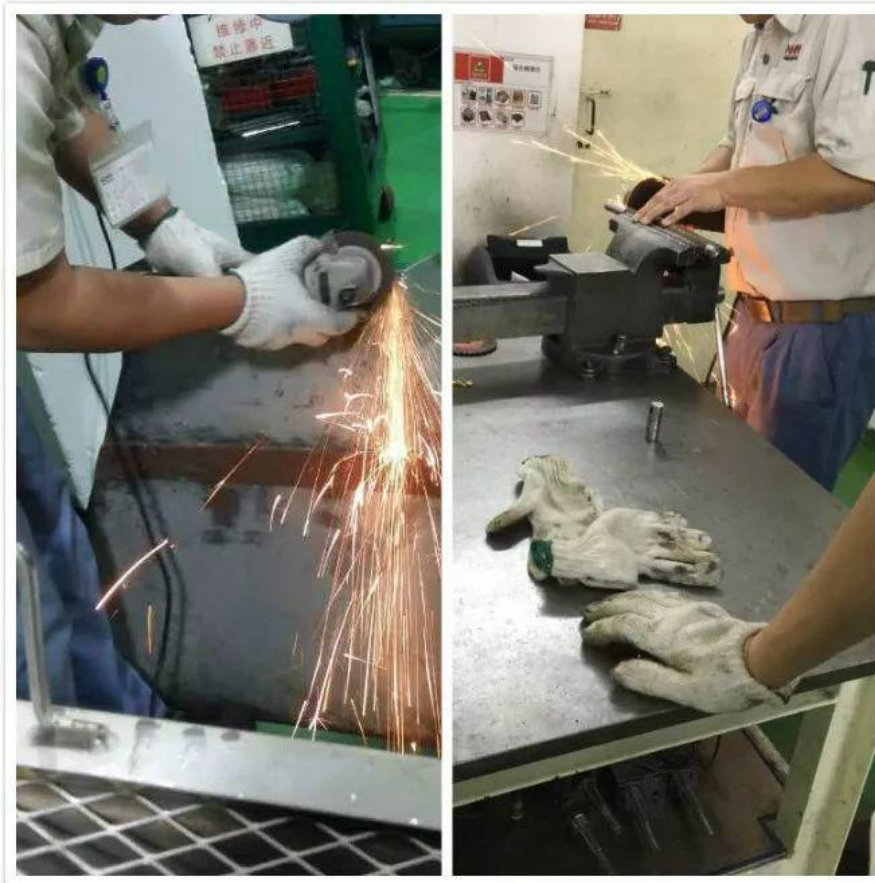
防護措置に難ありの危険な作業