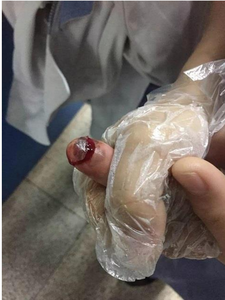
指がプレスでつぶされても労災申請できない