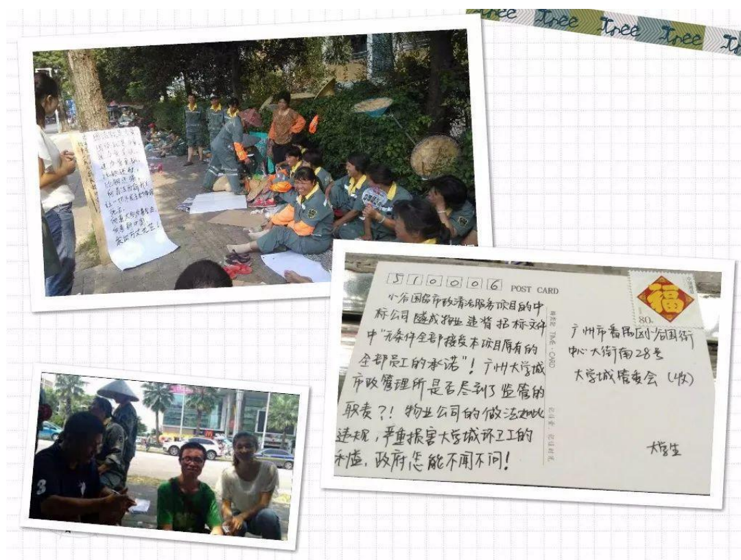
(左) スト清掃労働者と沈夢雨、(右) 清掃業務を所管する部門への手紙

に強い、労働者に支払うべき法定の失職手当を払わずにすませようとした。労働者代表が要求を出すと、会社は払うべきものの代わりに、脅しを送ってよこした。会社経営者は「そうだよ、お前らをいびっているのさ」と言わんばかりの傲岸な姿勢でいた。