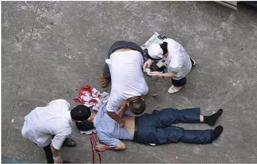
命を賭して抗議するフォックスコンの労働者

とを見つめなおすようになった。そして、珠江デルタで毎年労働者たちが失う 4 万本の指のこと、青春を都市に捧げながら都市に住み続けることができない 2 億 8 千万の農民工たちのことを考えるようになった。