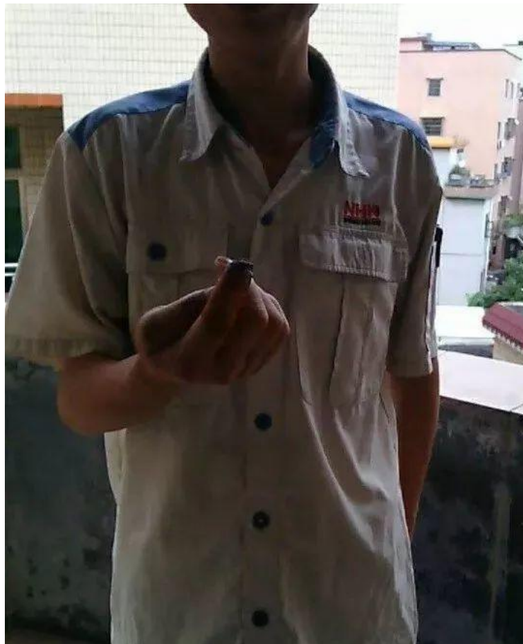
切断された指は永遠に心を痛める