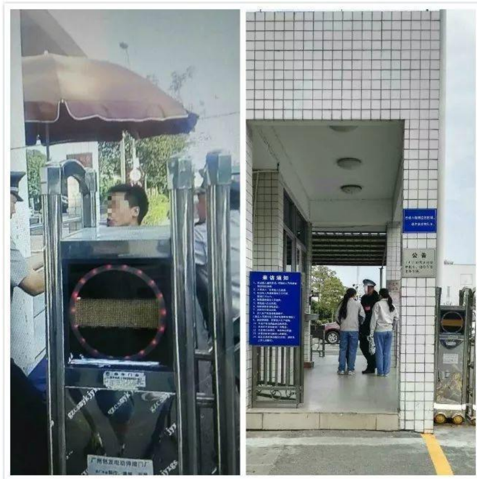
一方的に労働者を解雇して締め出す会社