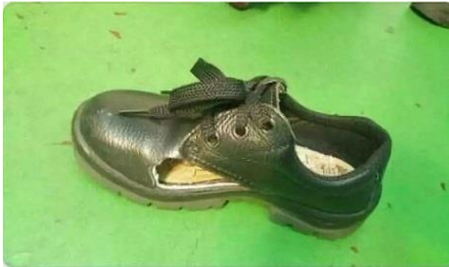
穴のあいた安全靴

私たちの昼夜は逆転し、機械のかわりに24時間絶えず叫び声をあげつづけている！ 私たちの不眠不休は経営者らが不労所得で富み栄える源泉になっている！ 私たちが屈辱をしのんで重責を担っても、寄生虫どもは得意満面でそれに応えるだけだ！ 私たちの勤勉な労働が、尊厳と権利によって応えられはしない！