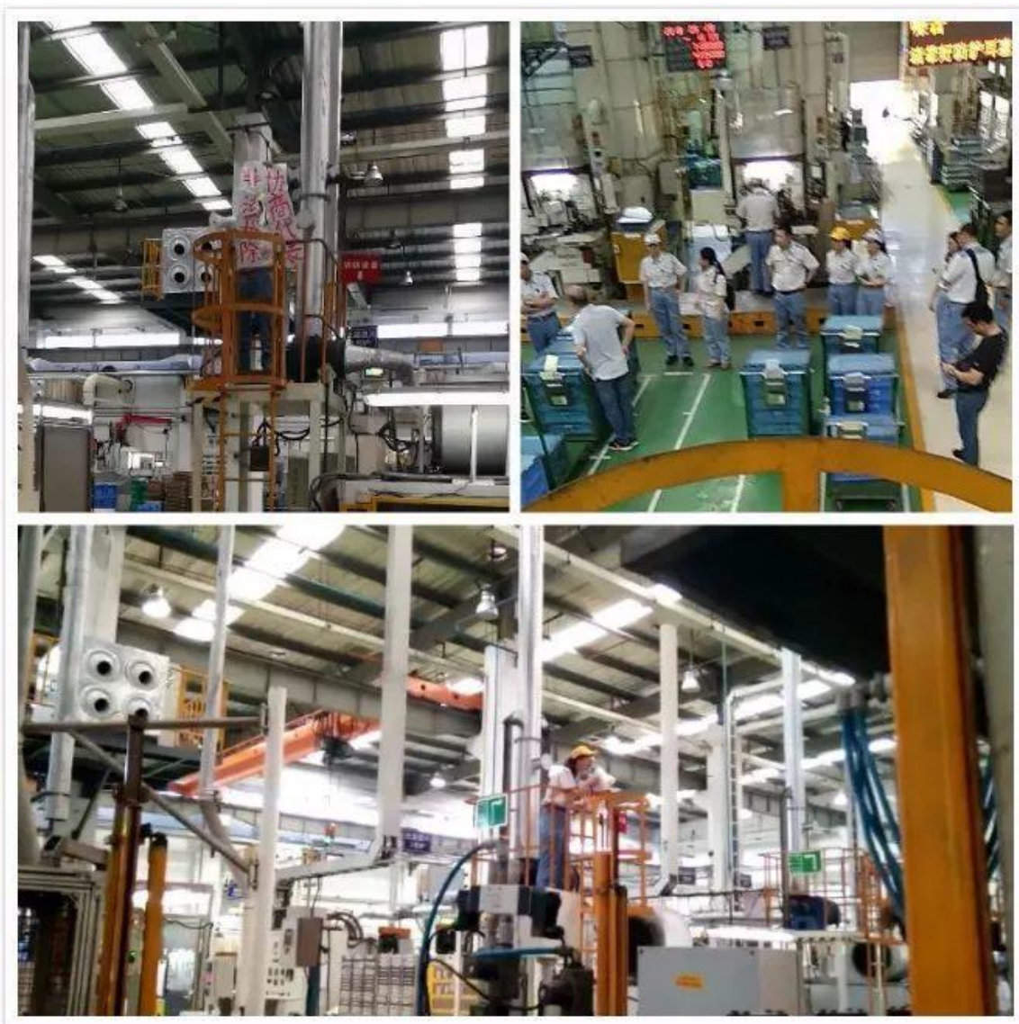
交渉員資格を不当に剥奪されたことに対して抗議

2018 年 5 月 28 日の早朝、組合執行委員会は秘密裏に会合を開き、組合員代表大会を回避して私の交渉員資格をはく奪した。午後 1 時、会社は私が上司に逆らって秩序を乱したという理由で私に対する懲戒処分を発表した。そして午後 4 時、一枚の懲戒解雇的な性格を持った通知を私に手渡し、一方的に私との雇用契約を解除することを通達した。