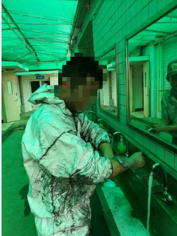
設備の中に入ってメンテナンス後、全身粉じんだらけの労働者