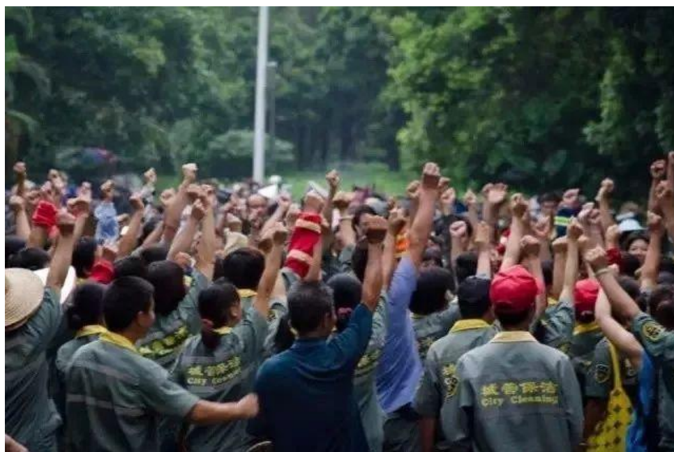
ストライキで氣勢を上げる清掃労働者たち

清掃労働者たちがありとあらゆる不当な仕打ちを受けていたというのに、労働局も地区当局もこれを顧みず、まるで自分たちには何の関係もないことであるかのような態度をとっていた。義憤にかられた学生たちは労働者のために闘い、声を上げた。彼らは労働者の団結と闘争精神に学び、心を打たれた。学生と労働者が力を合わせて20日間闘った結果、ストライキは成功を収めた。