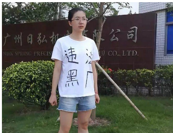
工場の外でも声を上げる

悪夢から目覚めた労働者は闇夜に戻ろうとはしない。立ち作業に慣れた者は跪くことをよしとしないだろう。学生から労働者へ、一般工員から交渉代表へと、労働者ととともにあり続けてきた私はますますその意志を固くするだろう。