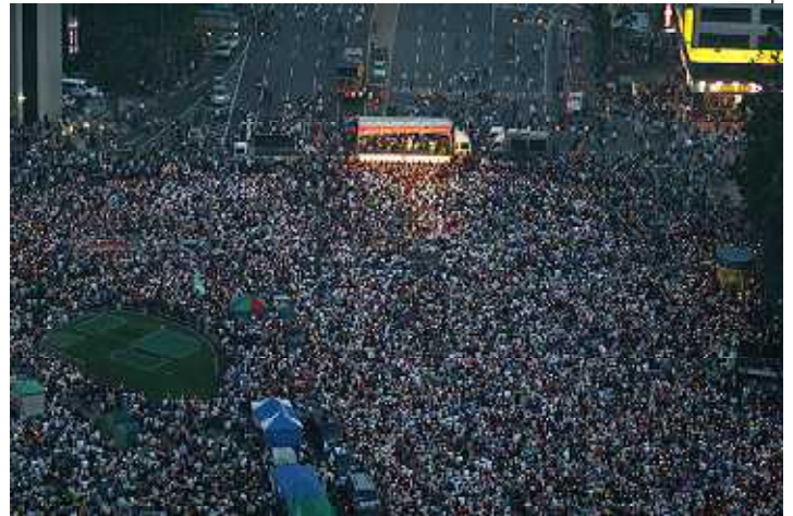
韓国のソウルキャンドル集会

これまでの社会運動の枠を越えた民衆が街を埋めたキャンドル集会は、メディア運動陣営ばかりでなく、既存の労働運動や社会運動にも厳しい反省を迫っている。キャンプに参加した韓国のある活動家